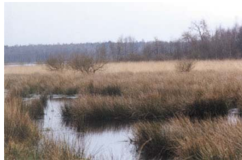
Moorlandschaft in De Peel

Die Glattnatter kann man hier normalerweise nur unter bestimmten Wetterbedingungen zu Gesicht bekommen, öfters sind die Tiere dann ganz oder teilweise versteckt und schwierig zu entdecken. In Gebieten, wo sie vorkommt, findet man auch die häufigste Eidechsenart der Niederlande, die Waldeidechse ( Zootoca v. vivipara ).