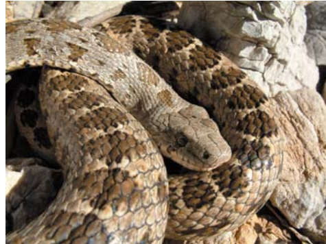
Hemorrhhois nummifer

Alle drei von Rhodos gemeldeten Amphibienarten konnten wir finden, darunter auch den seltenen Laubfrosch. Unter den Schildkröten wird in wenigen Listen das Vorkommen von Testudo graeca erwähnt. Sie dürfte aber extrem selten sein. Während wir alle Echsenarten und die Blindwühle beobachten konnten, sind uns einige Schlangenarten entgangen, die auf Rhodos vorkommen sollten: Allen voran die Katzenatter ( Telescopus fallax ) und die Leopardnatter ( Zamenis situlus ), die beide von REIFF (1995) gefunden wurden. Außerdem fehlten uns laut IOANNIDES et al. (1994) die Eidechsenatter ( Malpolon monspessulanus ), von der wir zwar eine Exuvie fanden, was wir aber nicht als sicheren Nachweis werten, und die offensichtlich extrem seltene Würfelnatter ( Natrix tessellata ).