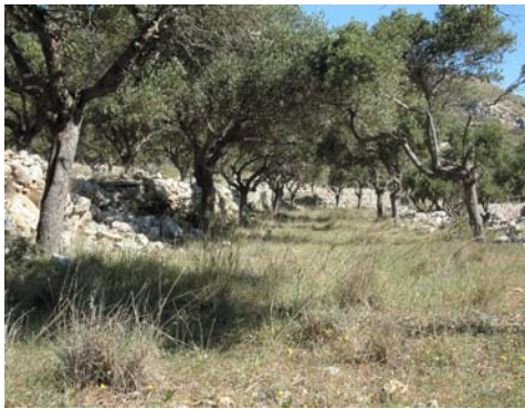
Olivenhain auf Rhodos

Die Insel Rhodos ist 80 km lang und 35 km breit mit einer Fläche von ca. 1300 km 2 . Sie ist damit die größte Insel im Dodekanes und die viertgrößte Griechenlands. Der Großteil der 115.000 Einwohner lebt im dicht besiedelten Norden der Insel, in und um Rhodos-Stadt. Im Gegensatz zum Norden ist der Süden spärlich besiedelt und eher von traditioneller Landwirtschaft geprägt. Zwischen den landwirtschaftlich genutzten Flächen finden sich karge Täler und karstige Berge. Dazwischen liegen aber auch bewaldete Hügel, Feuchtgebiete hingegen sind selten. Die Insel, auf der einst der Koloss stand (290 v. Chr.), ist von mildem Klima geprägt, allerdings weht häufig eine starke Brise. Der Niederschlag ist auf die Wintermonate beschränkt und klingt im April bereits wieder ab, wobei während unseres Aufenthaltes noch alle Bäche ausreichend Wasser führten.