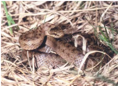
Männliche Schlingnatter aus De Peel

stimmten Stellen im Mooregebiet zu finden. Zu dieser Zeit werden dann von mir bis zu zehn trächtige Glattnattern gemeinsam angetroffen. Weibliche Tiere erreichen eine größere Länge als männliche, die man zudem noch viel seltener sieht. Männchen sind meistens etwas kräftiger und der Kopf ist etwas größer, ihre Unterseite geht in ein Braunrot über. Auch sind sie meist viel ruhiger als die Weibchen. Eine Besonderheit für De Peel ist der hohe Anteil an dunkel gefärbten Tieren. Dies ist mit dem dunklen Untergrund (Torf) zu erklären und kann als Camouflage-Effekt angesehen werden. Ein weiterer Vorteil ist das Vermögen, sich schneller aufwärmen zu können. Eine nähere Beobachtung zeigt, dass die Körperzeichnung bei solchen Tieren aus sehr breiten Flecken und Streifen besteht. Gestreifte Tiere findet man manchmal im Norden der Niederlande, auch in Österreich wurden solche Individuen mehrmals vom Autor gesichtet. Coronella austriaca ist lebendgebärend. Weil trächtige Tiere oft beieinander zu finden sind, kann man auch junge Schlingnattern in Massenansammlungen (bis zu 70 oder mehr) antreffen. Die Verschiedenheit der Zeichnung und Färbung ist immer wieder Grund dafür, dass man diese Art mit der Kreuzotter verwechselt. Einige Namen in diesem Gebiet, wie „Adderpaadje“ (= Kreuzotterpfad) erinnern immer noch daran. Die runde Pupille der Schlingnatter unterscheidet jedoch diese Art von der Kreuzotter mit ihrer senkrechten Pupille.