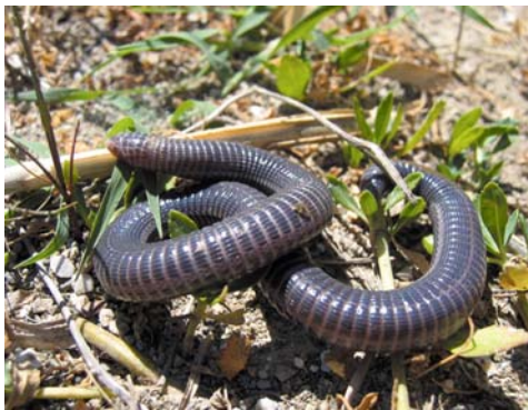
Blanus strauchi

Typhlops vermicularis , die Europäische Wurmsschlange, war auf Rhodos die häufigste von uns gefundene Schlange. Besonders im Osten der Insel ist sie recht häufig. Unter den gefundenen Tieren befand sich auch ein ungewöhnlich dickes, etwa 30 cm langes Tier, das wir mit einigen anderen in einem extensiv bewirtschafteten Olivengarten bei eingefallenen Gebäuden fanden.