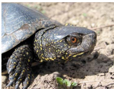
Männliche Emys orbicularis , Marchauen, NÖ

Nach derzeitiger Kenntnis ist die süditalienisch-sizilianische Unterartgruppe uneinheitlich und wartet auf eingehendere Untersuchungen. Überhaupt wird eine Reihe von Forschungsdefiziten aufgezeigt und bietet interessierten Herpetologen eine Fülle von Ansätzen für eigene Untersuchungen.