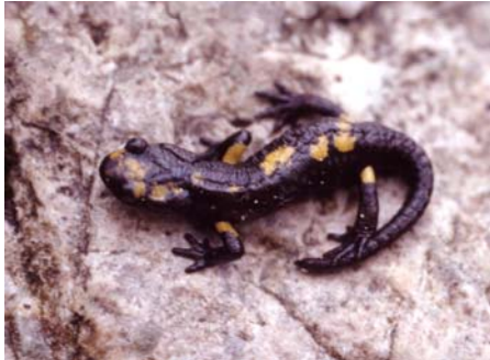
Salamandra atra ssp.

Zwei Jahre später, 2004, suchte das Team das Gebiet ein weiteres Mal auf. Vor allem um weitere Nachweise zu finden und somit das Areal der Form vorläufig umschreiben zu können. Bei dieser Exkursion zeigte sich allerdings eindrucksvoll, weshalb es derart spärliche Funde der Tiere gibt: Nachdem das Wetter offenbar nicht wirklich optimal war (kaum Regen), fand die Gruppe