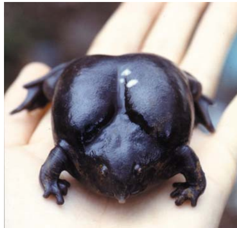
Nasikabatrachus sahyadrensis

der traditionellen indischen Medizin, Ayurveda („das Wissen vom langen Leben“) - der weltweit ältesten ganzheitlichen Heilmethode - schon seit Jahrhunderten eingesetzt. Der Genuss dieser Froschart verspricht eine Heilung der Atemwegserkrankung Asthma. Reiche Inder aus Delhi nehmen selbst den langen Weg nach Kerala auf sich, um einen Frosch zu erstehen. So werden für ein Exemplar für indische Einkommensverhältnisse erstaunliche Summen bezahlt. Als ich einem Kadar ein adultes Weibchen um 500 Rupien abkaufte, bot mir ein ayurvedischer Arzt den dreifachen Preis für den Weiterverkauf an. Dieser Betrag von 1500 Rupien entspricht etwa 30 Euro, eine für den durchschnittlichen Inder unerschwingliche Summe. Zumeist werden die Frösche im getrockneten Zustand aufbewahrt und wie Kleinode behandelt. Unter den lokalen Stämmen, die noch teilweise in den Wäldern der Western Ghats leben, ist Nasikabatrachus sahyadrensis gut bekannt. So erhielt ich, als ich ein Foto dieses unverwechselbaren Frosches einigen Kadar unter die Nase hielt, sofort ein eifriges Nicken als Antwort.